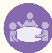
爭議解決專才及 業務交易律師