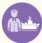
輪機工程師 及船舶總管