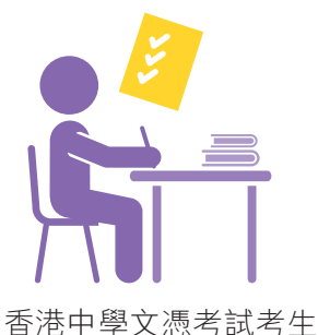
香港中學文憑考試考生