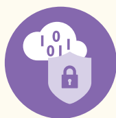
數據科學家及 網絡安全專家