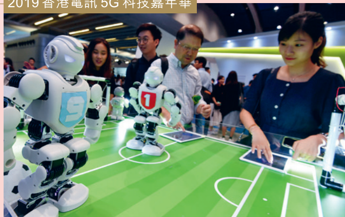
2019 香港電訊 5G 科技嘉年華