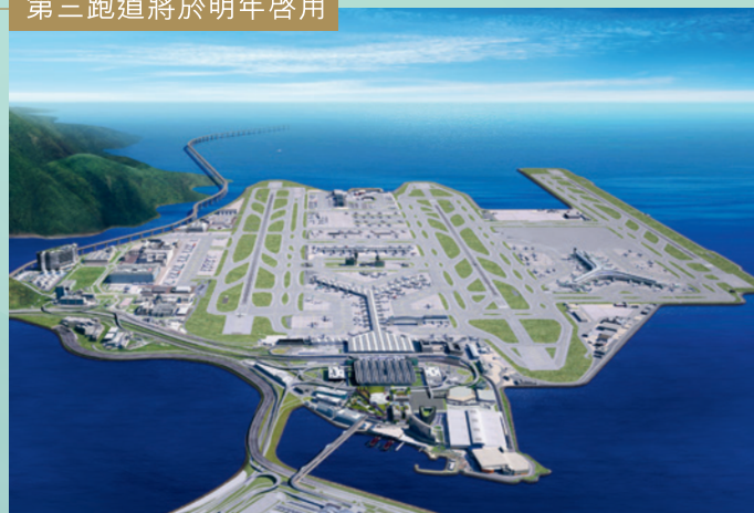
第三跑道將於明年啓用