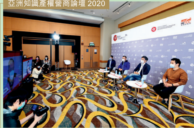
亞洲知識產權營商論壇 2020