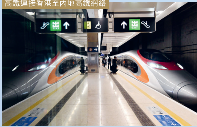
高鐵連接香港至內地高鐵網絡