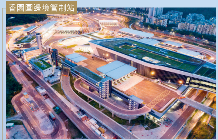
香園圍邊境管制站