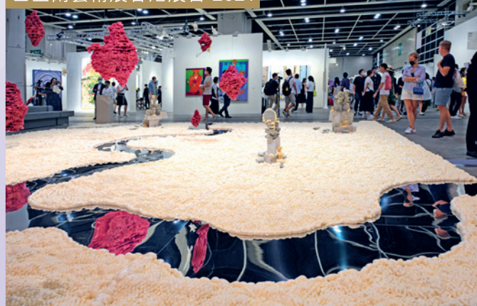
巴塞爾藝術展香港展會 2021