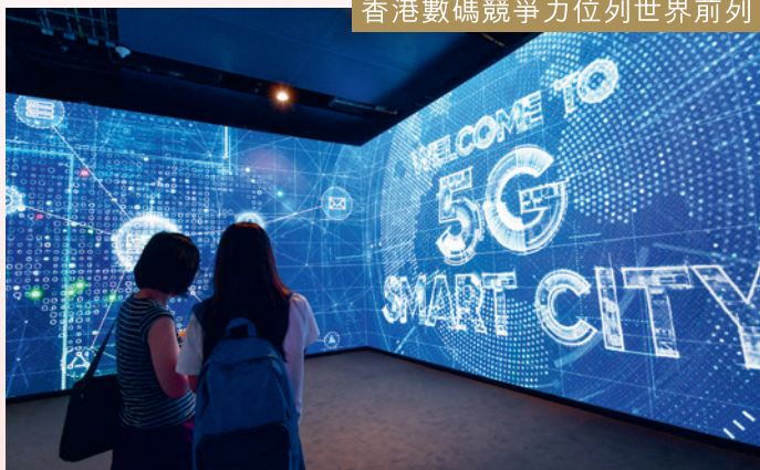
香港數碼競爭力位列世界前列