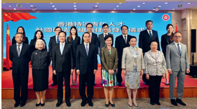
香港年青律師赴國際法律組織任職 發布儀式在2021年9月舉行